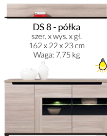
DS 8 - półka szer. x wys. x gł. 162 x 22 x 23 cm Waga: 7,75 kg