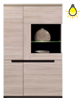
DS 5 - witryna szer. x wys. x gł. 90 x 145,5 x 38 cm Waga: 62,6 kg