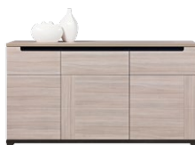
DS 3 - komoda szer. x wys. x gł. 162 x 87 x 40 cm Waga: 66,3 kg