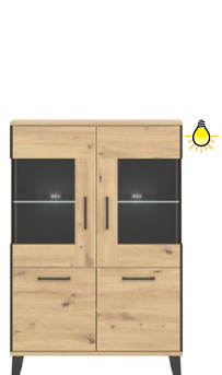
LT 5 - kredens szer. x wys. x gł. 90,5 x 135 x 40 cm Waga: 49,2 kg