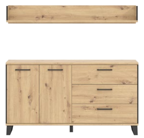
LT 13 - półka szer. x wys. x gł. 150 x 22 x 23,5 cm Waga: 9,35 kg