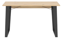
LT 16 - stół szer. x dł. x wys. 81 x 139 x 77 cm Waga: 48,65 kg