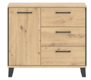
LT 2 - komoda szer. x wys. x gł. 90,5 x 82 x 40 cm Waga: 38,3 kg