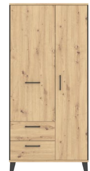
LT 9 - szafa szer. x wys. x gł. 90,5 x 193,5 x 54 cm Waga: 75,85 kg