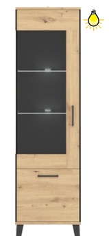
LT 6 - witryna lewa szer. x wys. x gł. 55 x 193,5 x 40 cm Waga: 43,97 kg