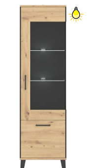
LT 7 - witryna prawa szer. x wys. x gł. 55 x 193,5 x 40 cm Waga: 43,97 kg