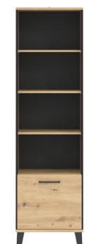
LT 8 - regał szer. x wys. x gł. 55 x 193,5 x 40 cm Waga: 36,1 kg