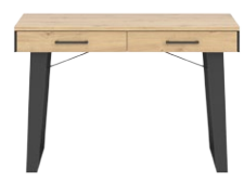
LT 14 - biurko szer. x dł. x wys. 64 x 118 x 77 cm Waga: 52,95 kg