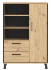
LT 4 - szafka szer. x wys. x gł. 90,5 x 135 x 40 cm Waga: 52,2 kg