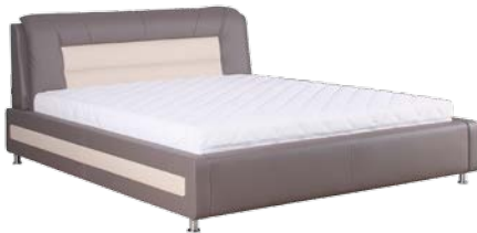
AX 19/160-180 łóże 160-180 szer./dł./wys. : 1805-2005/2390/870 (w opcji pojemnik na pościel)