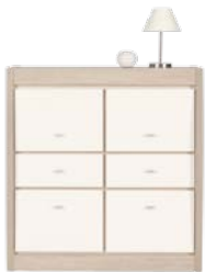
AX 6 szafka szer./gt./wys. 984/415/1046