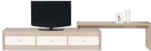
AX 1 RTV szer./gt./wys. 1903/470/382