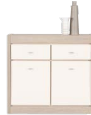
AX 4 szafka szer./gt./wys. 984/415/898