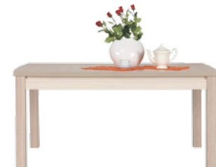
AX 12 stół rozkładany szer./dł./wys. 904/1604-2004/765