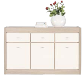
AX 5 szafka szer./gt./wys. 1444/415/898