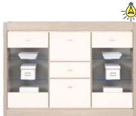
AX 7 kredens szer./gt./wys. 1444/415/1046