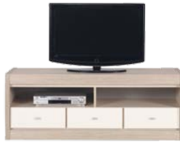
AX 2 RTV szer./gt./wys. 1444/475/552