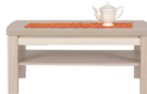
AX 11 ława szer./dł./wys. 674/1154/500