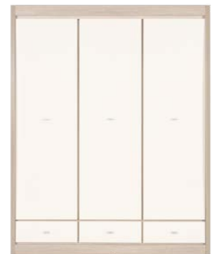
AX 10 szafa 3D szer./gt./wys. 1597/575/2004