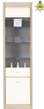
AX 8 witryna L/P szer./gt./wys. 550/415/2004