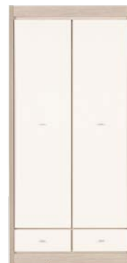
AX 9 szafa 2D szer./gt./wys. 984/575/2004