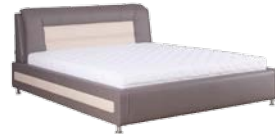
AX 19/160 łóże 160