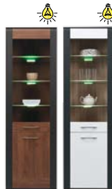
NA6 witryna L/P szer./gt./wys. 600/415/1940