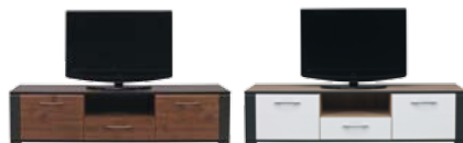
NA1 szafka RTV szer./gt./wys. 1595/495/400