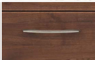
Wygodne uchwyty wykonane z metalu.