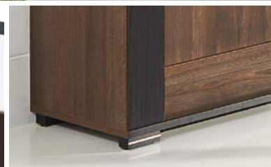
Drewniane nóżki z chromowaną wstawką.