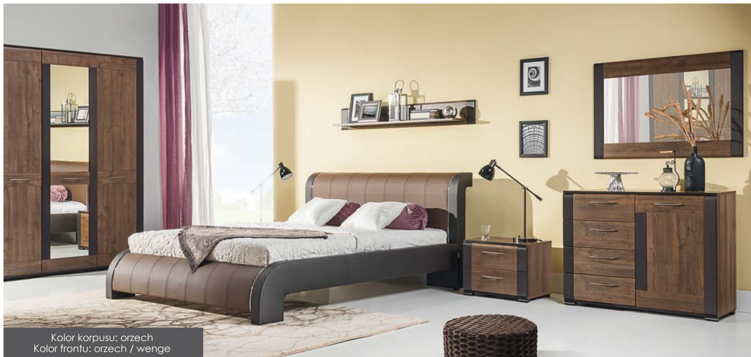
Kolor korpusu: orzech Kolor frontu: orzech / wenge