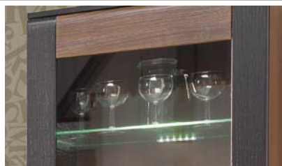
Opcjonalne podświetlenie LED do witryny i kredensu.