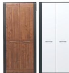
NA7 szafa 2D szer./gt./wys. 900/565/1940