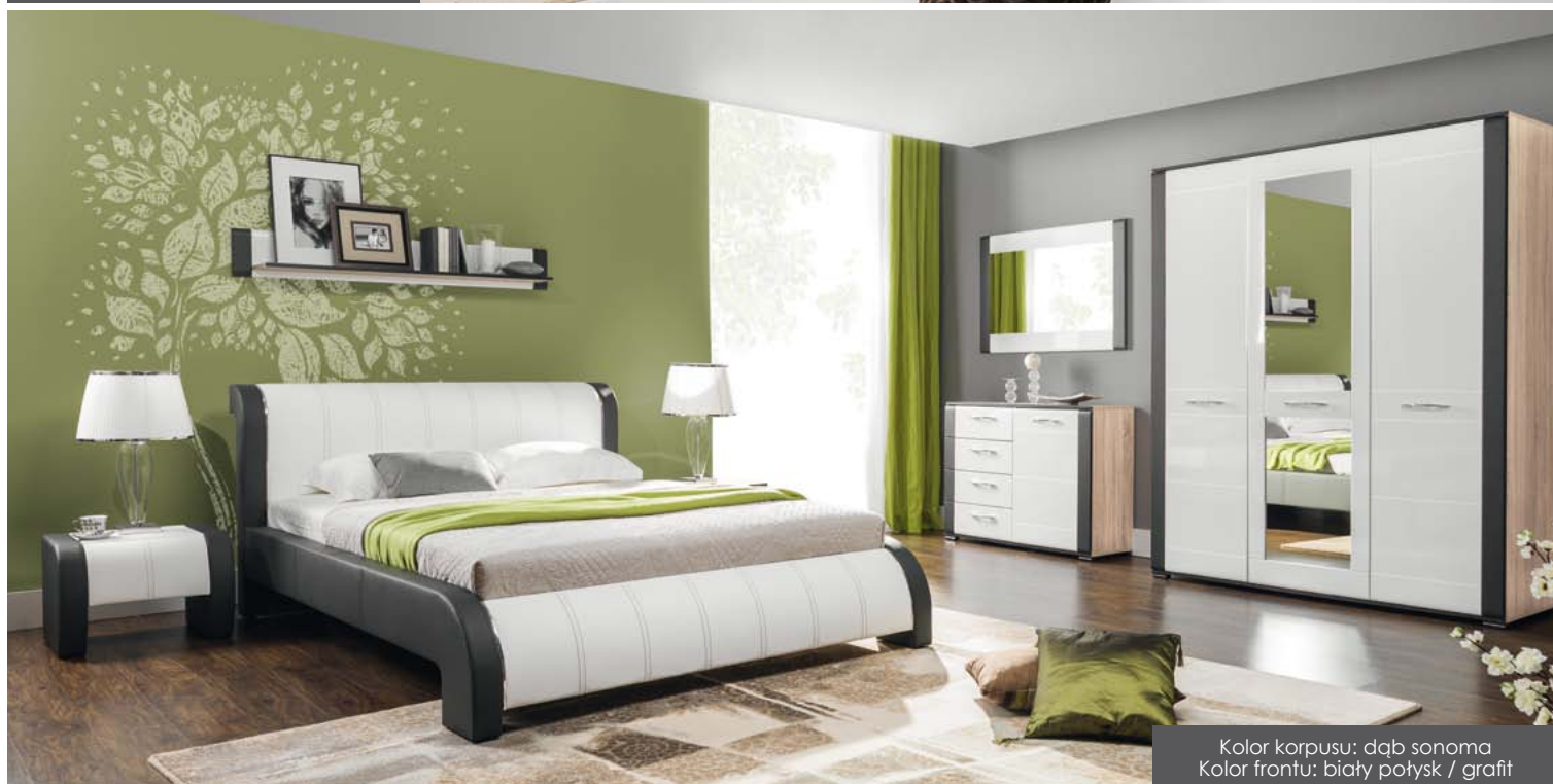
Kolor korpusu: dąb sonoma Kolor frontu: biały połysk / grafit