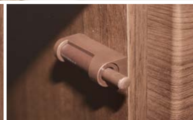
Hamulce do szafek w standardzie.