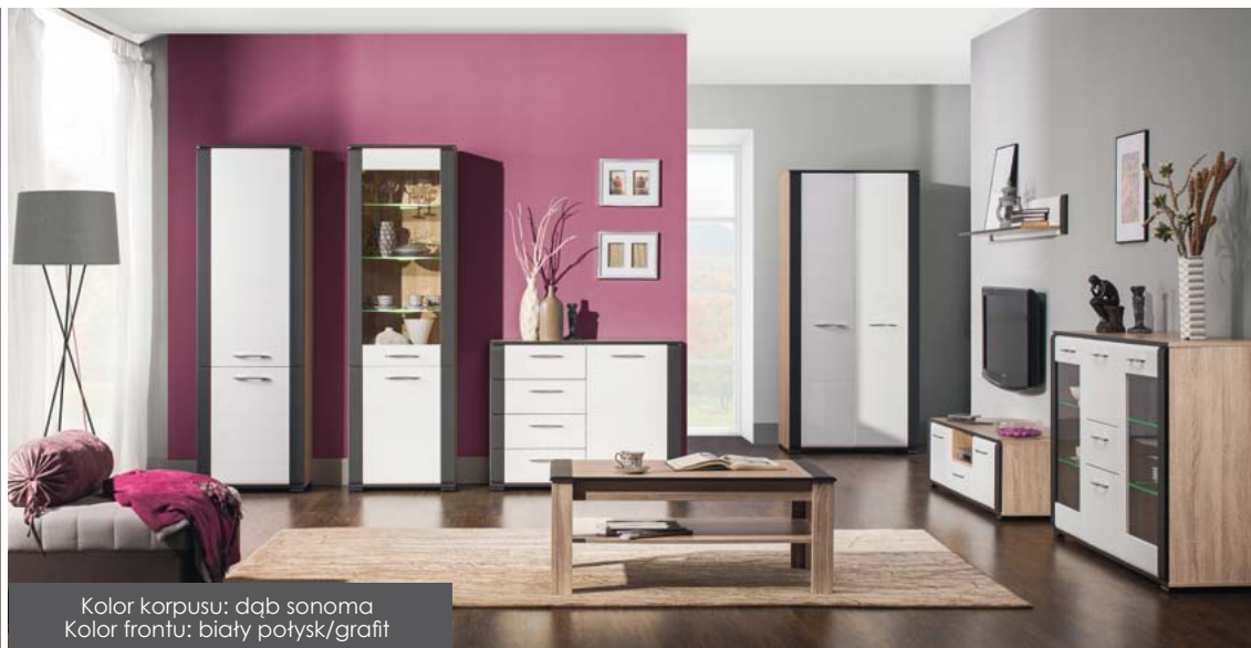
Kolor korpusu: dąb sonoma Kolor frontu: biały połysk/grafit