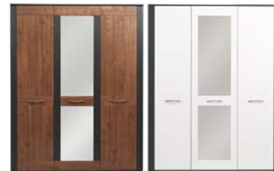
NA8 szafa 3D szer./gt./wys. 1595/565/2040