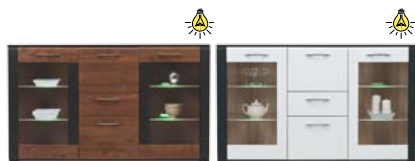
NA4 kredens szer./gt./wys. 1595/395/960