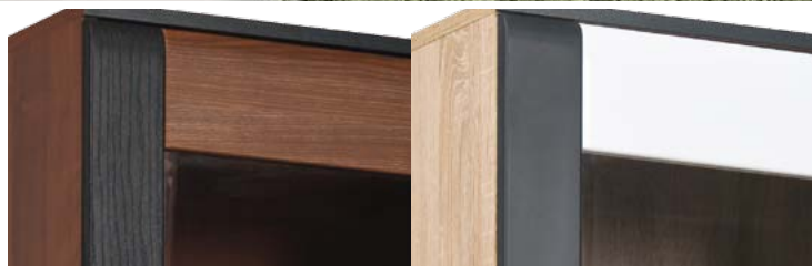
Korpusy wykonane z wysokiej jakości płyty laminowanej w dwóch wariantach kolorystycznych: ORZECH oraz DĄB SONOMA. Fronty wykonane z płyty MDF, pokryte folią PCV w kolorze ORZECH/WENGE oraz BIAŁY POŁYSK/GRAFIT.