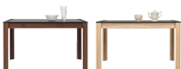
NA12 stół rozkładany szer./dt./wys. 820/1350-1850/765