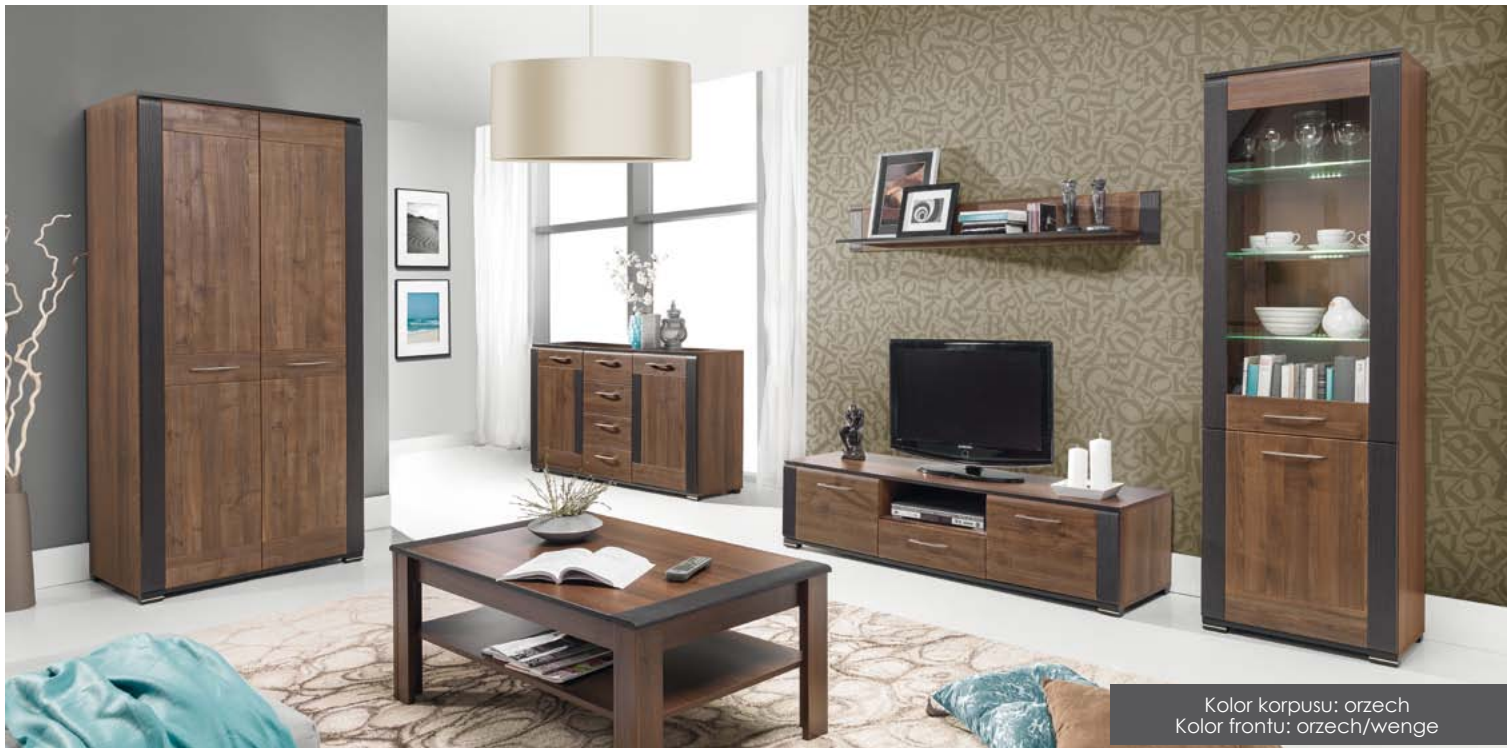
Kolor korpusu: orzech Kolor frontu: orzech/wenge