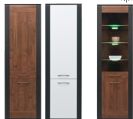
NA5 szafka szer./gt./wys. 600/415/1940