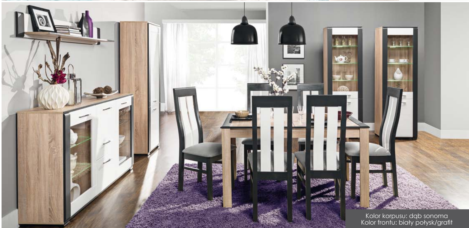
Kolor korpusu: dąb sonoma Kolor frontu: biały połysk/grafit