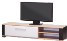
OT1 szafka RTV L/P szer./gt./wys. 1650/435/360