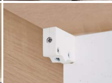
Zawieszki szafek górnych regulowane w trzech płaszczyznach.