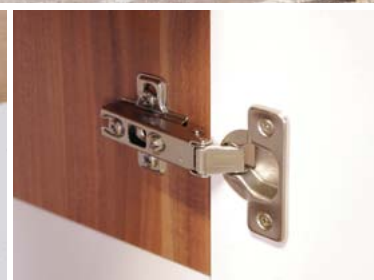
Zawiasy puszkowe \Phi 35mm regulowane w trzech płaszczyznach.