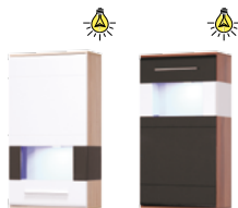
OT5 witryna wisząca L/P, góra/dół szer./gt./wys. 550/300/1020