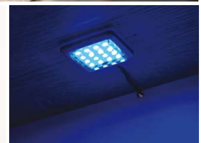
Opcjonalne podświetlenie LED do szafek i witryn wiszących.