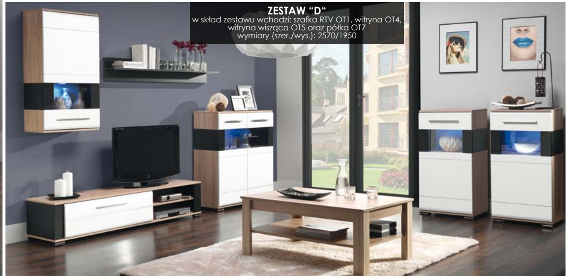
ZESTAW "D" w skład zestawu wchodzi: szafka RTV OT1, witryna OT4, witryna wisząca OT5 oraz półka OT7 wymiary (szer./wys.): 2570/1950