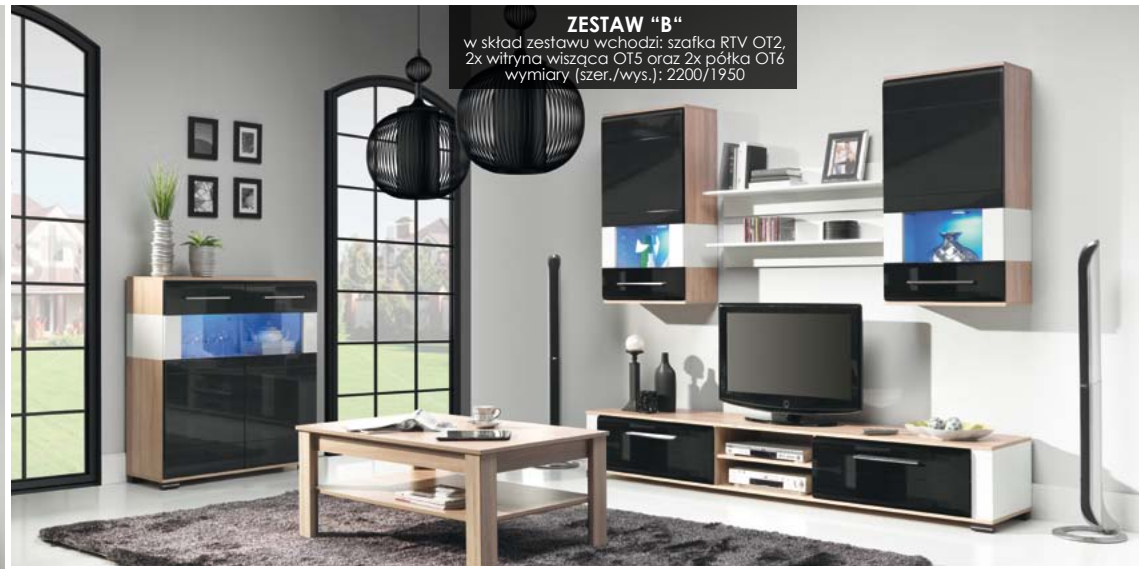
ZESTAW "B" w skład zestawu wchodzi: szafka RTV OT2, 2x witryna wisząca OT5 oraz 2x półka OT6 wymiary (szer./wys.): 2200/1950