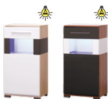
OT3 witryna L/P szer./gt./wys. 550/375/1060