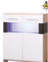
OT4 witryna szer./gt./wys. 920/375/1060