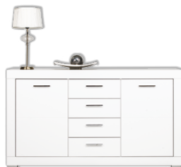
WH3 komoda szer./gt./wys. 155/40,5/90