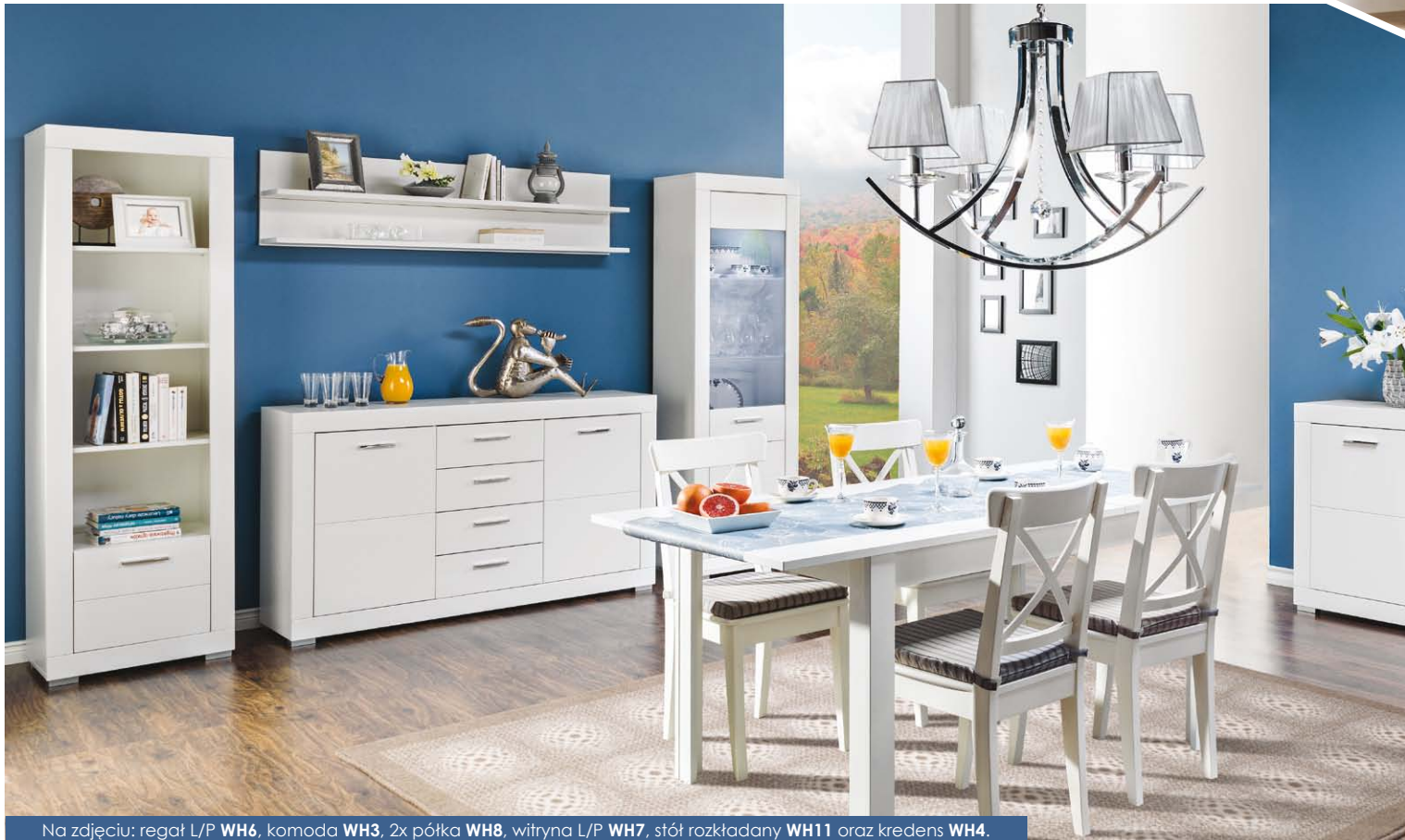
Na zdjęciu: regał L/P WH6 , komoda WH3 , 2x półka WH8 , witryna L/P WH7 , stół rozkładany WH11 oraz kredens WH4 .