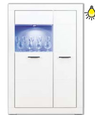
WH5 witryna szer./gt./wys. 96/40,5/143