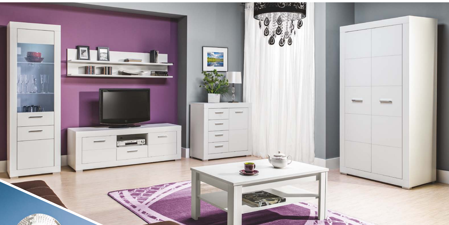
Na zdjęciu: witryna L/P WH7 , szafka RTV WH1 , 2x półka WH8 , komoda WH2 , ława WH10 oraz szafa 2D WH9 .