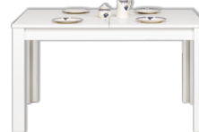
WH11 stół rozkładany szer./dl./wys. 86/135-185/77