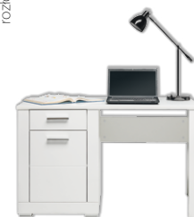
WH12 biurko szer./gt./wys. 128/67/77,5