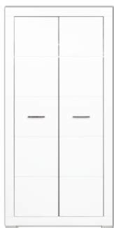
WH9 szafa 2D szer./gt./wys. 96/56/196