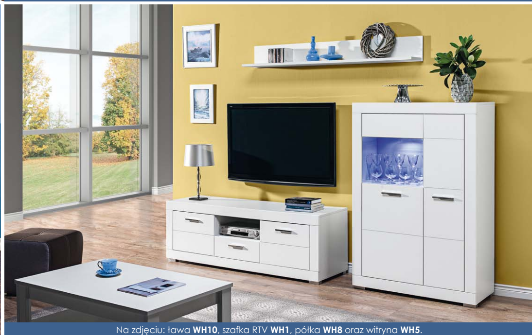
Na zdjęciu: ława WH10 , szafka RTV WH1 , półka WH8 oraz witryna WH5 .