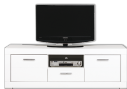
WH1 szafka RTV szer./gt./wys. 155/47/54,5