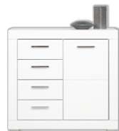
WH2 komoda szer./gt./wys. 96/40,5/90