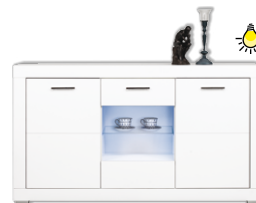
WH4 kredens szer./gt./wys. 155/40,5/90