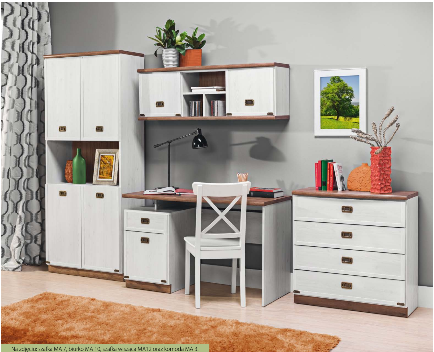
Na zdjęciu: szafka MA 7, biurko MA 10, szafka wisząca MA12 oraz komoda MA 3.