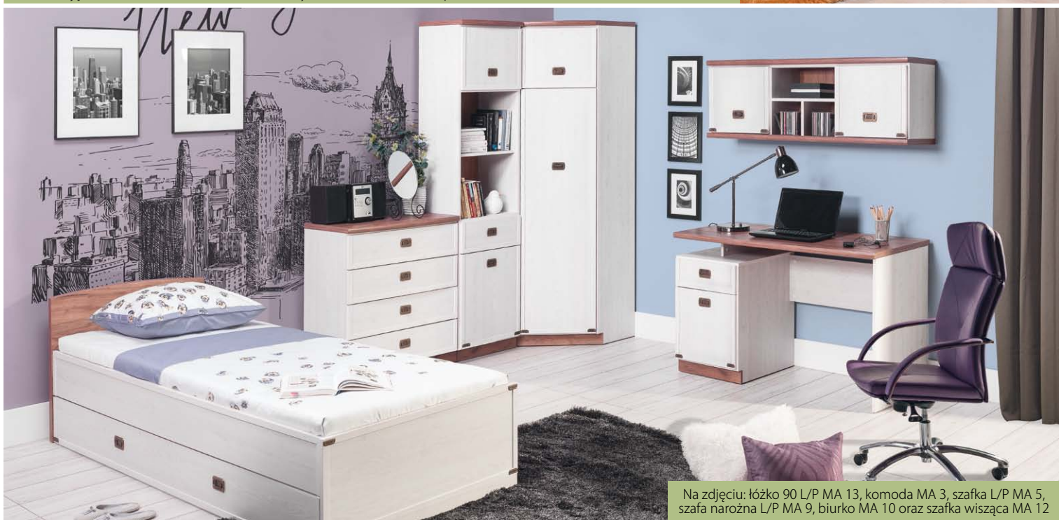
Na zdjęciu: łóżko 90 L/P MA 13, komoda MA 3, szafka L/P MA 5, szafa narożna L/P MA 9, biurko MA 10 oraz szafka wisząca MA 12