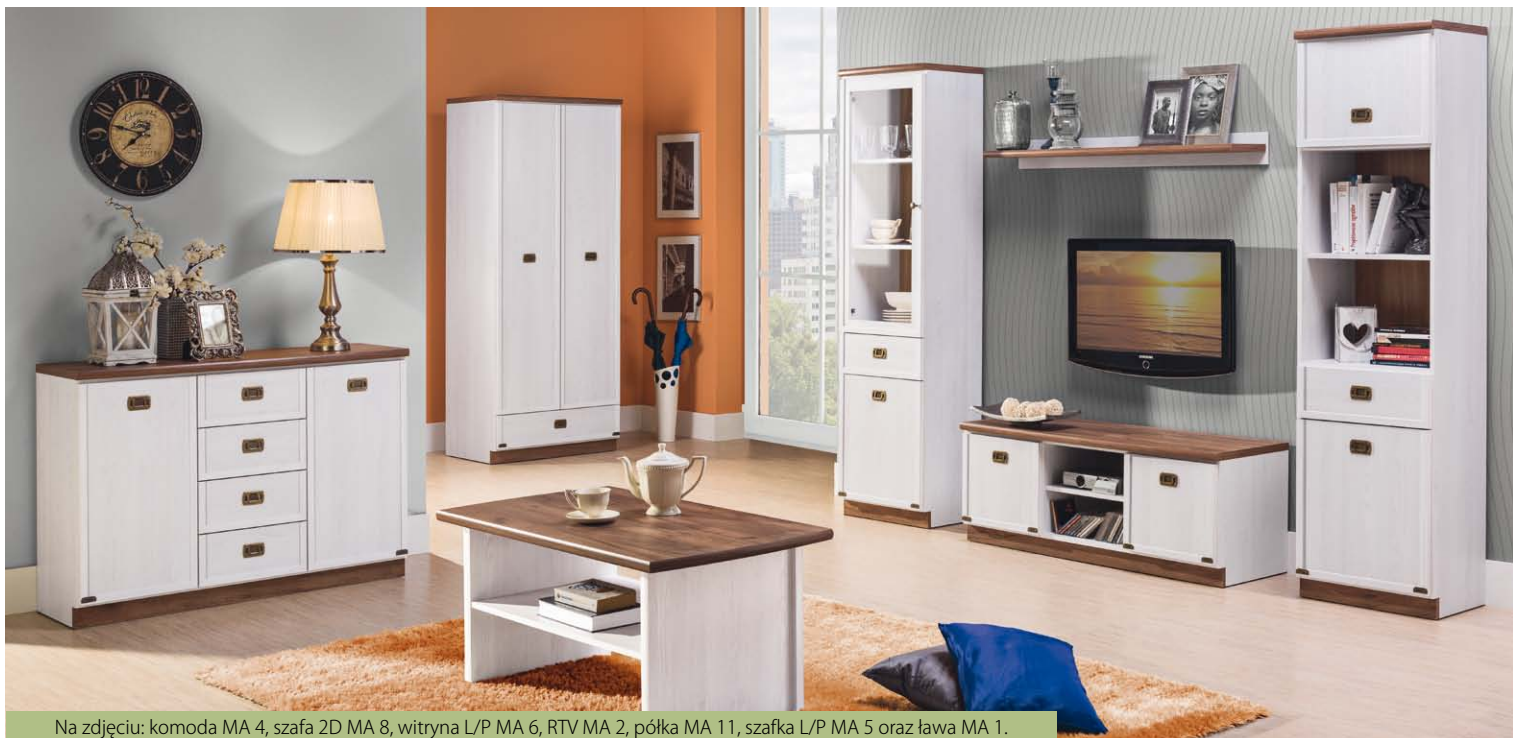
Na zdjęciu: komoda MA 4, szafa 2D MA 8, witryna L/P MA 6, RTV MA 2, półka MA 11, szafka L/P MA 5 oraz ława MA 1.