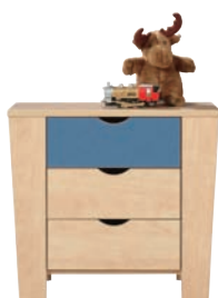
E 3 komoda szer./gt./wys. 794/386/726