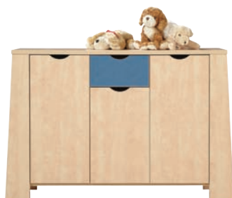
E 6 szafka szer./gt./wys. 1384/386/919