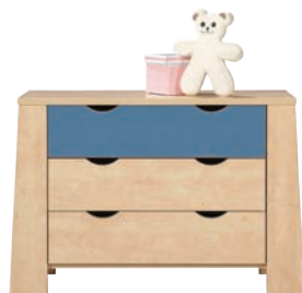
E 4 komoda szer./gt./wys. 1075/386/726