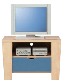
E 2 RTV szer./gt./wys. 773/502/533