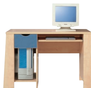
E 11 biurko szer./gt./wys. 1175/602/751