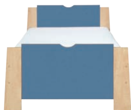
E 12 łóżko szer./gt./wys. 1000/2046/726 (bez pojemnika)