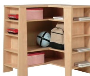
E 7 narożnik szer./gt./wys. 896/852/919