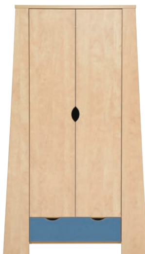
E 10 szafa szer./gt./wys. 1137/602/1954