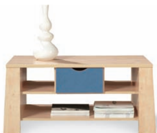
E 1 ława szer./gt./wys. 604/1151/533