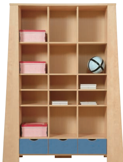
E 9 regał szer./gt./wys. 1497/386/1954