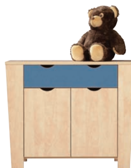
E 5 szafka szer./gt./wys. 1104/386/919