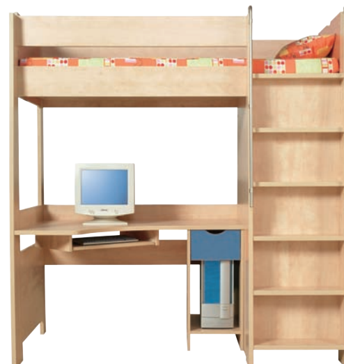
E 13 łóżko piętrowe szer./gt./wys. 1850/1030/1954