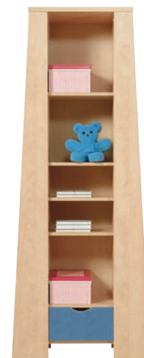
E 8 regał szer./gt./wys. 777/386/1954