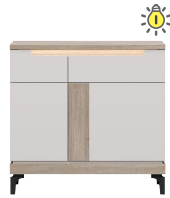
AN 02 - komoda sideboard → / ✂ / ↑ 90/39/87,5