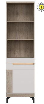
AN 07 - regał lewy bookstand (left) → / ✂ / ↑ 55/39/197