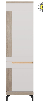
AN 09 - szafka lewa cabinet (left) → / ✂ / ↑ 55/39/197