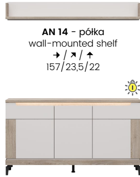
AN 14 - półka wall-mounted shelf → / ✂ / ↑ 157/23,5/22