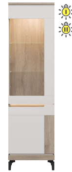
AN 06 - witrażna prawa glass-door display unit (right) → / ✂ / ↑ 55/39/197