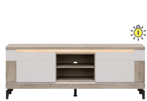
AN 01 - szafka RTV TV unit → / ✂ / ↑ 157/39/60

Korpus kolor: dąb cremona / kaszmir body colour: cremona oak / cashmere Materiał: płyta wiórowa laminowana Material: laminated chipboard