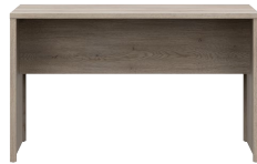
AN 12 - biurko desk → / ✂ / ↑ 128/68/77