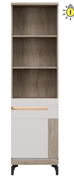
AN 08 - regał prawy bookstand (right) → / ✂ / ↑ 55/39/197