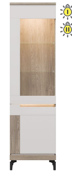
AN 05 - witrażna lewa glass-door display unit (left) → / ✂ / ↑ 55/39/197