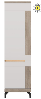
AN 10 - szafka prawa cabinet (right) → / ✂ / ↑ 55/39/197