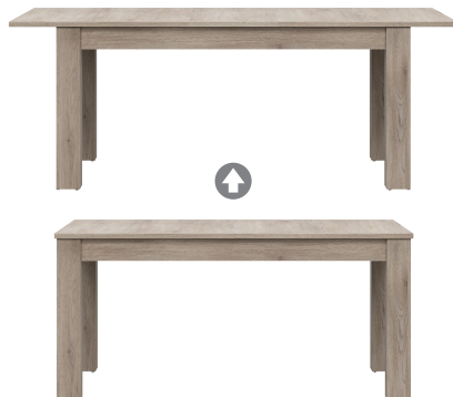
ST 10 - stół rozkładany extendable table → / ✂ / ↑ 160-200/90/76