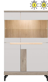
AN 04 - witrażna niska glass-door sideboard → / ✂ / ↑ 90/39/143