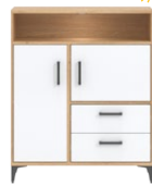
CN4 -komoda sideboard →/↗/↖ 89,5/40/108