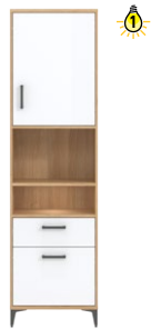
CN7 -szafka L/P unit (left/right) →/↗/↖ 53,5/40/194,5