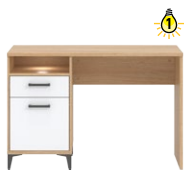
CN15 -biurko desk →/↗/↖ 118/60/79