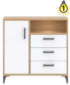
CN2 -komoda sideboard →/↗/↖ 89,5/40/88,5