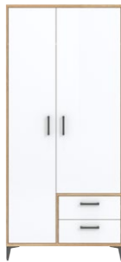
CN8 -szafa wardrobe →/↗/↖ 89,5/54/194,5