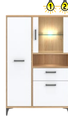
CN5 -kredens glass-door sideboard →/↗/↖ 89,5/40/141