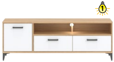
CN1 -szafka RTV TV unit →/↗/↖ 153,5/40/54,5

Wszystkie wymiary w centymetrach. Meble do samodzielnego montażu. The measurements are given in cm Furniture for self-assembly