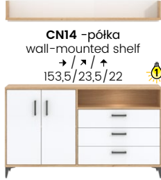
CN14 -półka wall-mounted shelf →/↗/↖ 153,5/23,5/22 CN3 -komoda sideboard →/↗/↖ 153,5/40/88,5