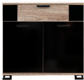
GT 02 - komoda sideboard → / ✂ / ↑ 92 / 39,5 / 88,5