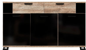
GT 03 - komoda sideboard → / ✂ / ↑ 152,5 / 39,5 / 88,5