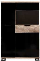
GT 04 - witryna glass-door display unit → / ✂ / ↑ 92 / 39,5 / 141

Wszystkie wymiary w centymetrach. Meble do samodzielnego montażu. The measurements are given in cm Furniture for self-assembly