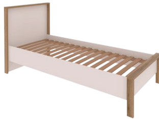
AR 16 -łóżko 90 →/↗/↖ 99x214x98