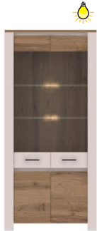
AR 8 -witryna 2D →/↗/↖ 90x40x195