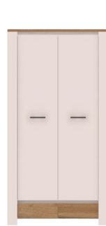
AR 9 -szafa 2D →/↗/↖ 100x53x195