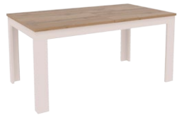
AR 13 -stół rozkładany →/↗/↖ 162-230x90x75