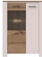
AR 5 -witryna →/↗/↖ 100x40x135