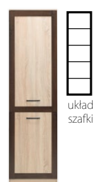
BS 9 - szafka →/↗/↖ 55/33,5/198