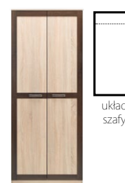
BS 10 - szafa 2D →/↗/↖ 80/52,5/198