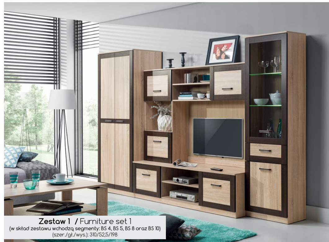
Zestaw 1 / Furniture set 1 (w skład zestawu wchodzi segmenty: BS 4, BS 5, BS 8 oraz BS 10) (szer./gt./wys.): 310/52,5/198

Bog FRAN MEBLE ® meble przyjazne dla domu