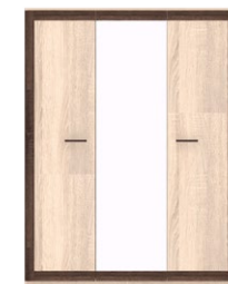
BS 22 - szafa 3D z lustrem →/↗/↖ 149,8/52/197,8