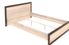
BS 19/140-160 - łóżko 140-160 →/↗/↖ 158-187/204,2/90