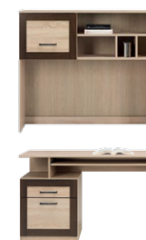
BS 11 - biurko →/↗/↖ 120/54,5/76,5