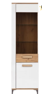
SB9 - witryna prawa glass-door display unit (right) →/↗/↖/↑ 56,5/39,5/197