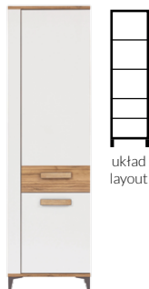
SB10 - szafka lewa/prawa unit (left / right) →/↗/↖/↑ 56,5/39,5/197