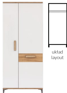
SB11 - szafa wardrobe →/↗/↖/↑ 85/56/197