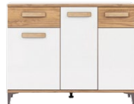
SB3 - komoda sideboard →/↗/↖/↑ 114/39,5/90