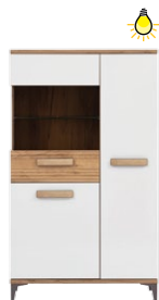
SB6 - witryna glass-door sideboard →/↗/↖/↑ 85/39,5/145