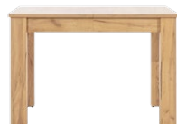
SB14 - stół rozkładany extendable table →/↗/↖/↑ 112-145-178/90/76