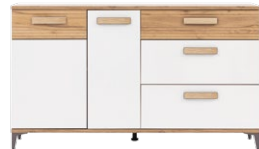
SB4 - komoda sideboard →/↗/↖/↑ 155,5/39,5/90