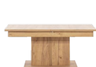
SB13 - ława rozkładana extendable coffee table →/↗/↖/↑ 114-144/68/51,5