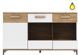
SB5 - kredens glass-door sideboard →/↗/↖/↑ 155,5/39,5/90