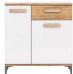
SB2 - komoda sideboard →/↗/↖/↑ 85/39,5/90